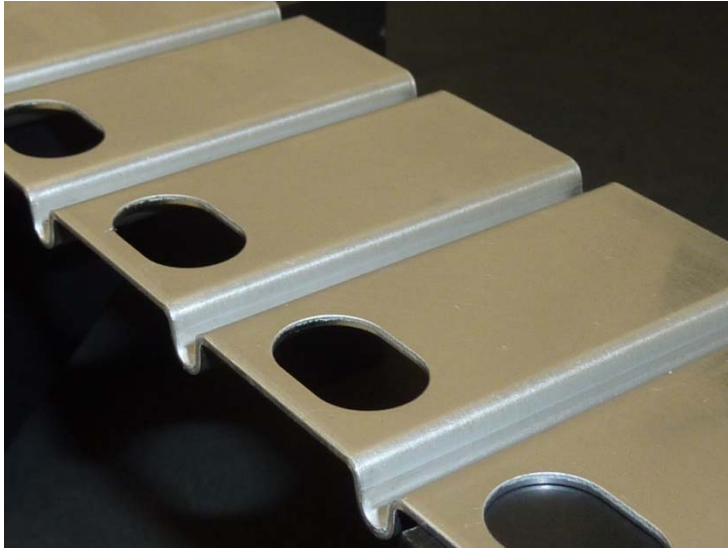
Peça de perfuração