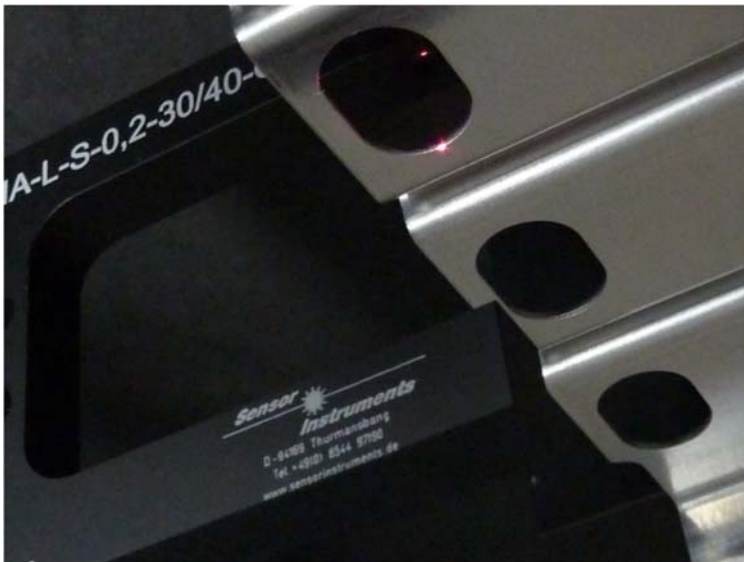
Posicionamento preciso da peça de perfuração usando a barreira fotoelétrica em forma de forquilha FIA-L-RL